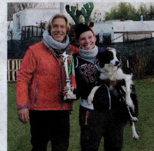
Lorella con Gazza ha vinto la categoria Senior e con Chico (small)